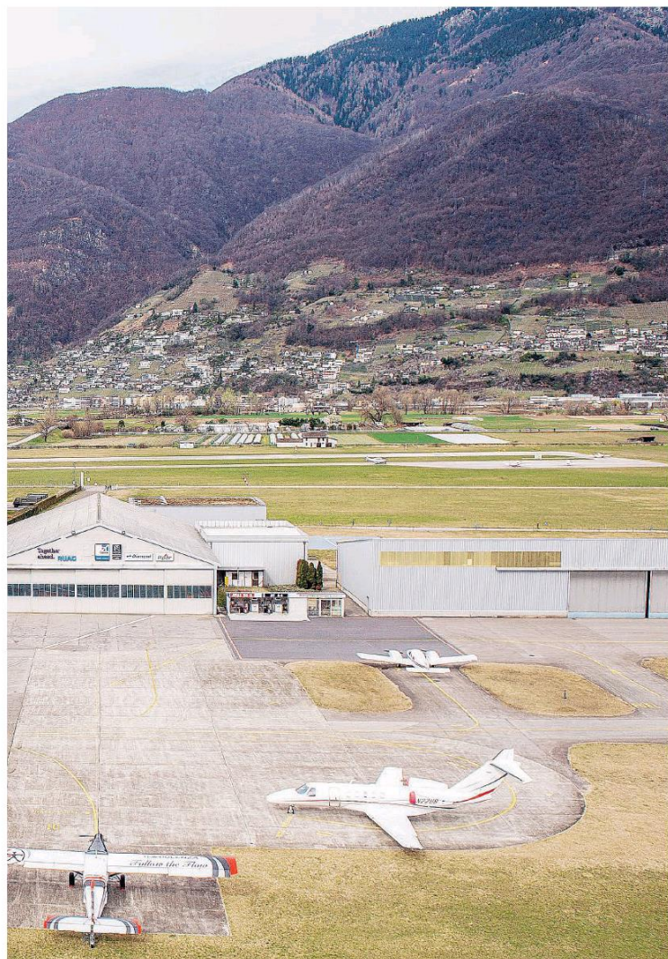
L'Alba è preoccupata, il governo sta preparando la risposta