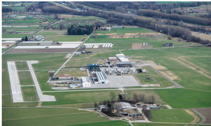
Si attendono i nullaosta da Berna e si tiene vivo l'interesse per questa realtà aviatoria

Consiglio strategico per l'Associazione a difesa dello scalo