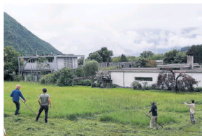
Sotto a chi tocca

Ha riscosso un buon successo di partecipanti il corso 'falciare con la ranza', organizzato di recente dal Gruppo di volontari dei giardini naturali comunali a Tegna, nelle Terre di Pedemonte. Proposta che rientra nell'ambito delle iniziative sostenute dal Comune di Terre di Pedemonte allo scopo di trasmettere conoscenze, curiosità e astuzie per promuovere la biodiversità nei giardini privati, gestire malerbe e neofite invasive e smaltire correttamente il materiale tagliato. Tutto questo contribuendo, in maniera pratica, alla realizzazione e alla gestione di un giardino naturale comunale. La formula è quindi quella di una partecipazione attiva da parte delle cittadine e dei cittadini interessati