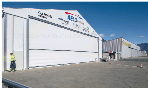
Da anni si attende il nullaosta da Berna, ma per ora nessun segnale dalla capitale

I temi in vista dell'assemblea dell'Associazione