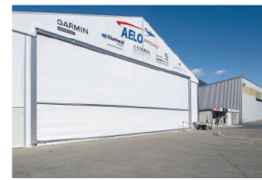
Sarà sostituito da un vero e proprio hangar